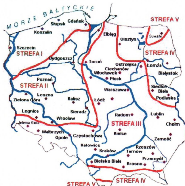
Rys. 1 Strefy klimatyczne Polski i temperatury obliczeniowe

Położenie obiektu, w którym planowany jest montaż, na mapie ma wpływ na pracę instalacji oraz na dobór mocy projektowanego kotła. W zależności od współrzędnych geograficznych rozbieżności w temperaturach projektowych mogą mieć znaczącą wartość i wpływ na zapotrzebowane na ciepło w budynku. W skali kraju ilustruje to poniższa mapa (Rys.1).